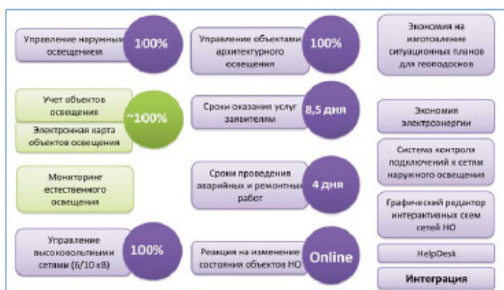
Планируемые показатели на 2015 год