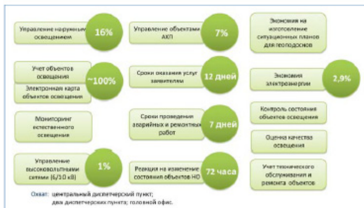
Показатели ИИУСНО в 2010 г.

Эта система станет еще одной частью ИИУСНО.