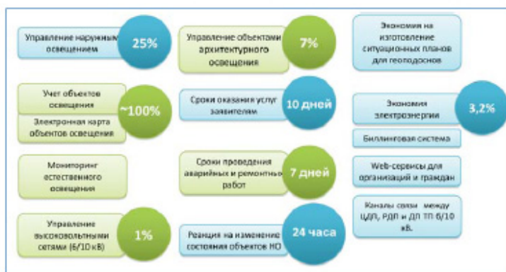
Планируемые показатели на 2014 год

Внедрение новых технологий в управлении наружным и функциональным освещением, создание АСУ архитектурным освещением и КАСУАО, их интеграция в ИИУСНО создают дополнительные предпосылки для активизации работ по реализации системно-технических решений ИИУСНО и интеграции с ИТС Москвы.